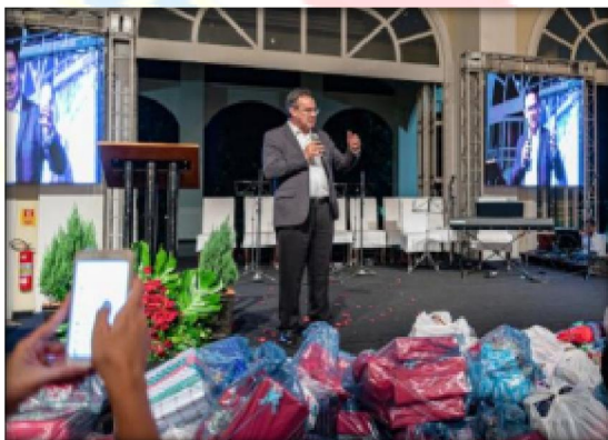
Dr. Augusto Cury

W tym roku IPA Brazil włączyła do projektu kolację charytatywną. Najważniejszym punktem tego wydarzenia był wykład znanego pisarza Augusto Cury, oraz muzyczny występ Szkoły Muzycznej Suzuki Music School, a także sopranów, tenorów i barytonów oraz znanych instrumentalistów i pianistów. W uroczystej chwili dokonano symbolicznego przekazania darów kierownictwu brazylijskiej poczty, Correios do Brasil, w celu dostarczenia ich do domów oraz do kierowników wybranych podmiotów. Ale na tym się nie skończyło, ponieważ prezenty dla dzieci zostały również dostarczone przez brazylijskiego Ojca Bożego Narodzenia IPA, Papę Noela, oraz jego asystentów, bezpośrednio do dzieci w świetlicach, domach dziecka, szkołach i społecznościach tubylczych.