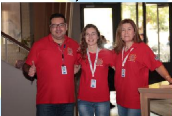
Komitet organizacyjny IPA Grecja