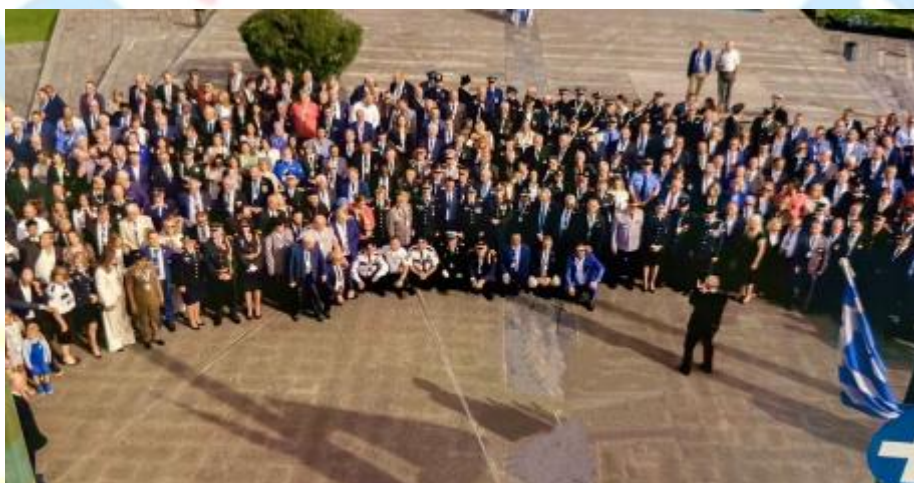
Delegaci 66. Kongresu Światowego IPA 2023, Ateny

Ponadto mamy w przygotowaniu szereg innych inicjatyw, które mają na celu wzmocnienie naszej organizacji. Inicjatywy te obejmują zarówno programy edukacyjne i możliwości szkoleniowe, jak i wymiany kulturalne i projekty współpracy. Naszym celem jest zapewnienie cennych korzyści naszym członkom, przy jednoczesnym zapewnieniu, że IPA pozostanie dynamiczną i myślącą przyszłościowo organizacją.