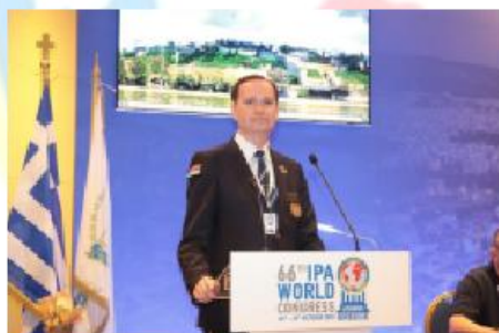
IPA Serbia - Prezentacja