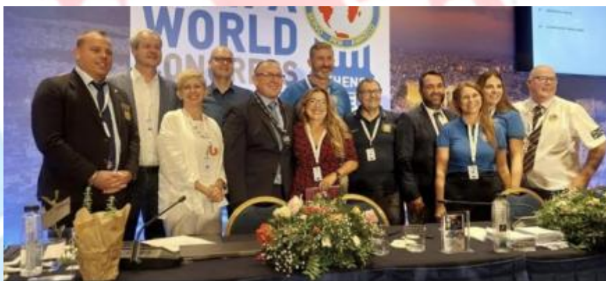
Nowy Zarząd Międzynarodowy (IEB) - 2023-2027