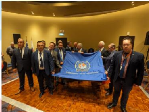
IPA Grecja przekazuje flagę IPA Macedonia Północna

W sobotę IPA Grecja zorganizowała wycieczkę po muzeum Akropolu dla delegatów, obserwatorów i gości. Ten dzień towarzyski, podczas którego wszyscy mogli podziwiać historię, architekturę i zapierające dech w piersiach pięknego miasta Ateny.