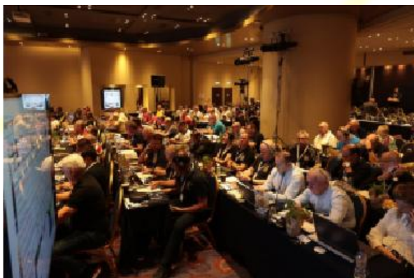
Sala konferencyjna - Ateny

Program był bardzo napięty, a nasi gospodarze z IPA Hellenic wykonali świetną robotę, planując i przygotowując wszystkie wydarzenia, a także dostarczając delegatom wymaganych informacji za pomocą kodu QR na smyczy.