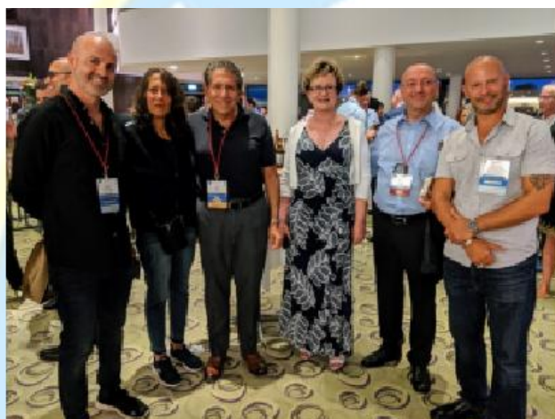
94. Doroczna Konferencja W.A.D. 2019 w Sztokholmie, Szwecja