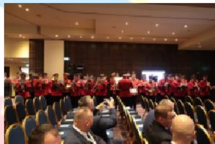
Ceremonia otwarcia - orkiestra dęta

Bardzo oczekiwany Kongres Światowy IPA rozpoczął się we wtorek 24 października gdy delegaci, obserwatorzy i goście z 66 sekcji przybyli do Wyndham Grand Hotel w Atenach. Goście zostali powitani drinkami we wtorkowy wieczór w hotelowym lobby, a następnie kolacją w formie bufetu. Energia była wysoka, a delegaci obejmowali się nawzajem, ponieważ niektórzy spotkali się po raz pierwszy, a inni ostatnio widzieli się ponad rok temu na 65. Kongresie Światowym IPA w Hiszpanii.