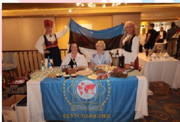
IPA Estonia - Jedzenie i napoje podczas spotkania

Niezwykle udane spotkanie, podobnie jak w poprzednich latach odbyło się w atrium hotelu po prezentacjach.