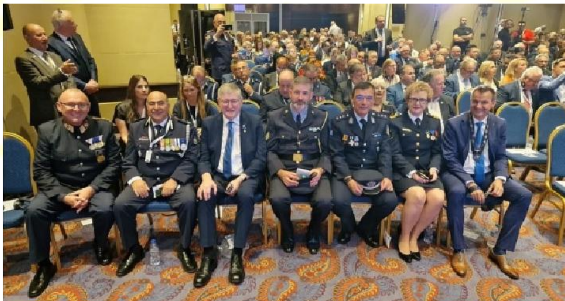
Poprzedni Zarząd Międzynarodowy - 2019-2023